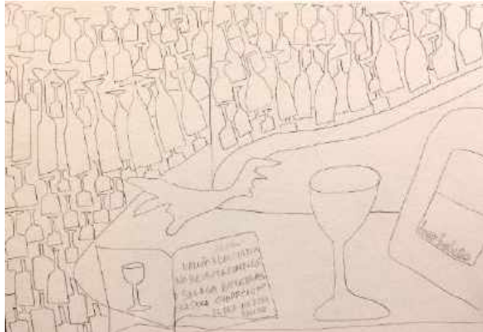
Figura 11 – Desenho da Lulu Defran

e autora da peça “O crânio”. Foi entrevistadora na Rádio USP de 2010 a 2011 no programa “Franka em Cena”.