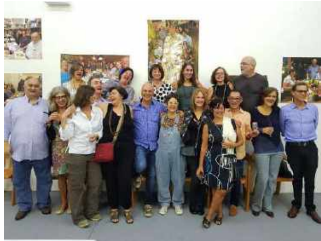
Figura 3 – Exposição na Funarte

Em julho, foi feito um convite pelos proprietários do Bar Balcão, onde aconteceu a segunda exposição, de 29 de agosto a 15 de outubro, desta vez com desenhos feitos no local.