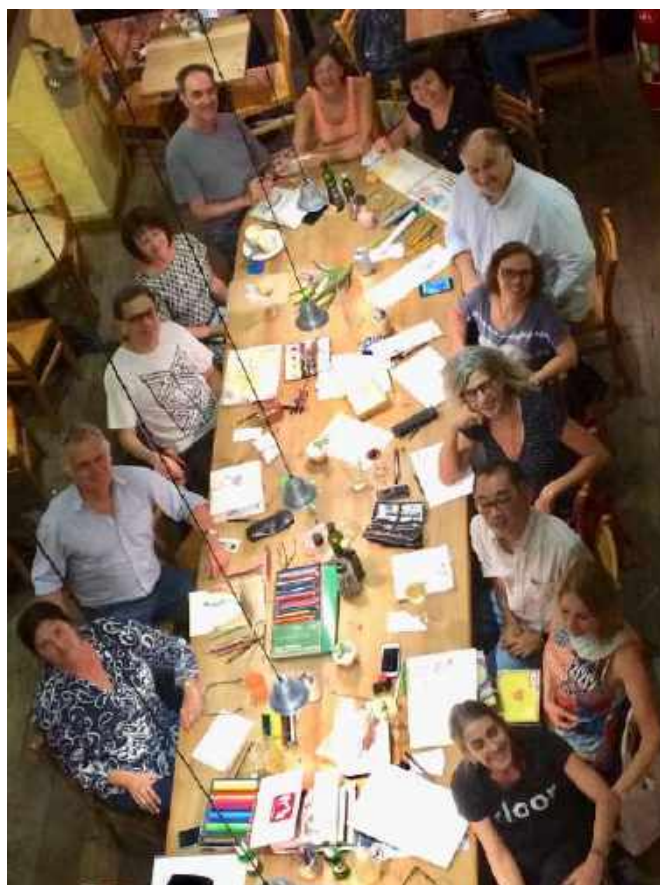
Figura 1 – Encontro na Padaria “Le Pain Quotidien” da Vila Madalena- São Paulo

Se fosse para resumir em uma frase, poderíamos dizer que "rabisqueiros" é um grupo de arquitetos formados pela FAUUSP (a maioria), que se reúnem uma vez por semana, em São Paulo, para desenhar. Mas é muito mais: é um estado de espírito.