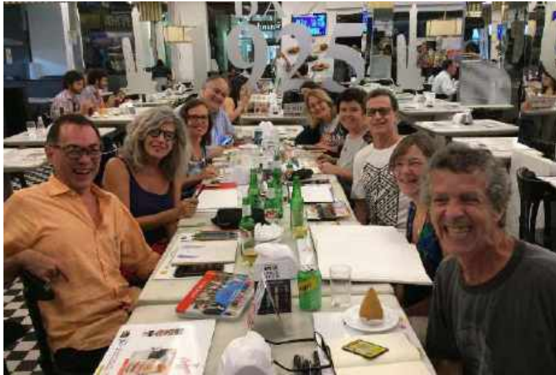
Figura 2 – Encontro na Padaria Bologna – São Paulo

Desenhar por prazer (muito prazer) sem a intenção de se tornarem artistas plásticos profissionais.