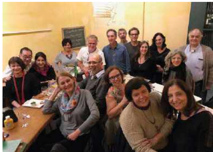
Figura 4 – Encontro no Bar Balcão

Em julho, foi feito um convite pelos proprietários do Bar Balcão, onde aconteceu a segunda exposição, de 29 de agosto a 15 de outubro, desta vez com desenhos feitos no local.